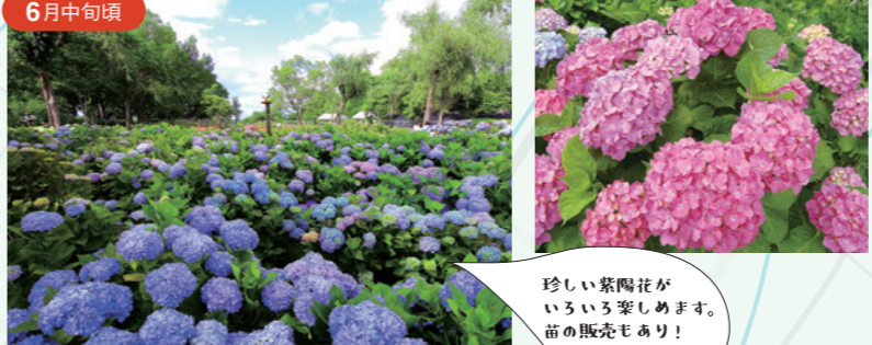
珍しい紫陽花がいろいろ楽しめます。苗の販売もあり!

22 もりやま芦刈園 国内外のそれぞれ50品種、約10000本のあじさいが鮮やかな花を咲かせます。 杉江町地先 TEL.077-585-7133 8:00～19:00(6～7月) 9:00～16:00(8～5月) シーズン中のみ有料 大人200円 中学生以下・障がい者・65歳以上100円 火曜日(祝日の場合は翌日)、年末年始※シーズン中は無休 P 40台 JR守山駅から近江鉄道バス杉江循環線「杉江東口」下車 徒歩20分