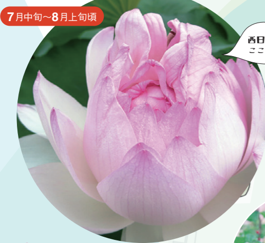
西日本てここだけ!

18 近江妙蓮公園 花びらが数千枚にも及ぶ珍しい種で、平安時代の初め、慈覚大師が唐から持ち帰ったと伝えられ、県の天然記念物、市の市花に指定されています。 中町39 TEL.077-582-1340 9:00～17:00 7、8月の指定期間のみ有料 大人220円 中学生以下・障がい者・65歳以上110円 火曜日(6～9月)、月～木曜日(10～5月)祝日除く、年末年始 30台 JR守山駅から近江鉄道バス 服部線「田中」下車、徒歩3分