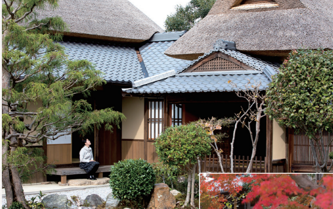
36 大庄屋諏訪家屋敷 主屋、書院、庭園などが江戸時代の趣を今に伝えています。

赤野井町171-1 TEL.077-516-8160 9:00~17:00(最終入館16:30) 火曜日(祝日の場合は翌日)、祝日の翌日、年末年始 大人300円 小中学生・障がい者150円 団体割引・年間パスポートあり 赤野井西別院駐車場、地域総合センター駐車場 JR守山駅から近江鉄道バス 小浜線「赤野井別院」下車徒歩5分