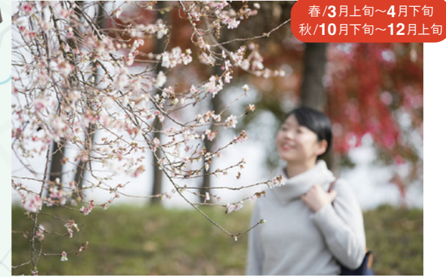
春/3月上旬～4月下旬 秋/10月下旬～12月上旬

22 もりやま芦刈園 国内外のそれぞれ50品種、約10000本のあじさいが鮮やかな花を咲かせます。 杉江町地先 TEL.077-585-7133 8:00～19:00(6～7月) 9:00～16:00(8～5月) シーズン中のみ有料 大人200円 中学生以下・障がい者・65歳以上100円 火曜日(祝日の場合は翌日)、年末年始※シーズン中は無休 P 40台 JR守山駅から近江鉄道バス杉江循環線「杉江東口」下車 徒歩20分